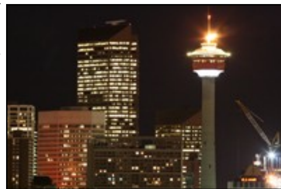
La flamme qui danse au sommet de la Calgary Tower symbolise l'aube d'un nouveau jour.