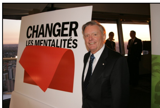
M. Michael Kirby, président de la CSMC, dévoile le nouveau logo de l'initiative « Changer les mentalités ».

Le nouveau nom de l'initiative « anti-stigmatisation et anti-discrimination » de la Commission a été lancé en grand le vendredi 2 octobre, à Calgary, en Alberta. L'initiative « Changer les mentalités » représente l'effort systématique le plus important de l'histoire canadienne visant à réduire les préjugés associés à la maladie mentale.