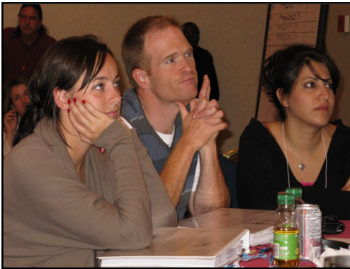
Des participants intéressés écoutent un exposé.

En septembre, près de 150 personnes de toutes les régions du Canada ont assisté à la première activité de formation nationale concernant le projet At Home/Chez Soi , qui s'est tenue à Toronto.