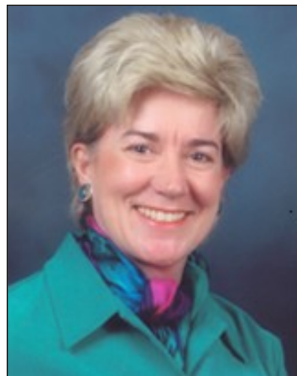
Kathryn Power, directrice de la SAMHSA

Un certain nombre de thèmes communs, en lien avec les pertes d'emploi et les préoccupations de la population concernant la sécurité d'emploi, ont émergé de la table ronde. Les représentants de tous les pays ont déclaré qu'une hausse du nombre de demandes d'aide, en particulier chez les jeunes hommes, ainsi qu'une hausse de la violence familiale avaient été constatées. De plus, les services d'aide ont observé qu'un plus grand nombre de demandeurs provenaient de la classe moyenne, ce qui constitue un phénomène relativement nouveau par rapport aux récessions passées. Un rapport présentant les conclusions de la réunion peut être obtenu sur le site de web de la CSMC.